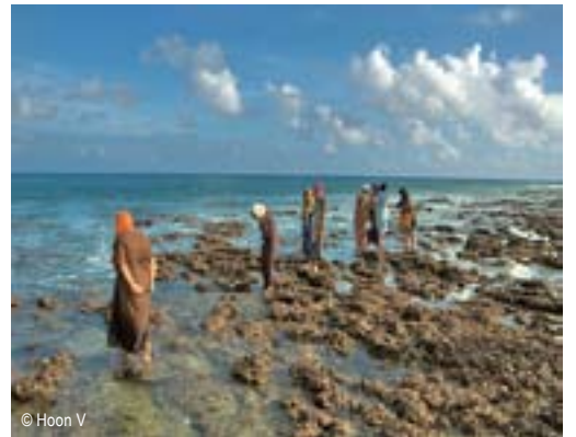
रीफ ग्लैनिंग, अगाती द्वीप - एक सामाजिक पिछलासमय