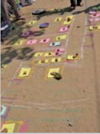
बाक्स 3: इदिनथाकालपुदुर, सामाजिक प्रतिचित्रण, गल्फ ऑफ मन्नार, भारत

सामाजिक प्रतिचित्रण, गल्फ ऑफ मन्नार के इस उदाहरण में, एक अध्ययन दल ने भिन्न-भिन्न रंगों के कार्डों द्वारा घरों को दर्शाया है। यह रंग भिन्न प्रकार के घरों को दर्शाने में उपयोग में आये हैं, इस प्रकार हरा कार्ड छप्पर वाले घर को, गुलाबी टाईल वाले घर को और पीला एक पक्के घर को दर्शाता है। प्रत्येक परिवार के विवरण इन कार्डों में दर्ज किये गये हैं, शैल, सीक, पत्तियाँ, बीज आदि को कार्डों पर रखा गया है जो कि परिवारों की मुख्य अभिलक्षण, जनसांख्यिकीय विशेषता, व्यवसाय विवरण और संबंधित संपत्ति / गरीबी दर्शाते हैं।